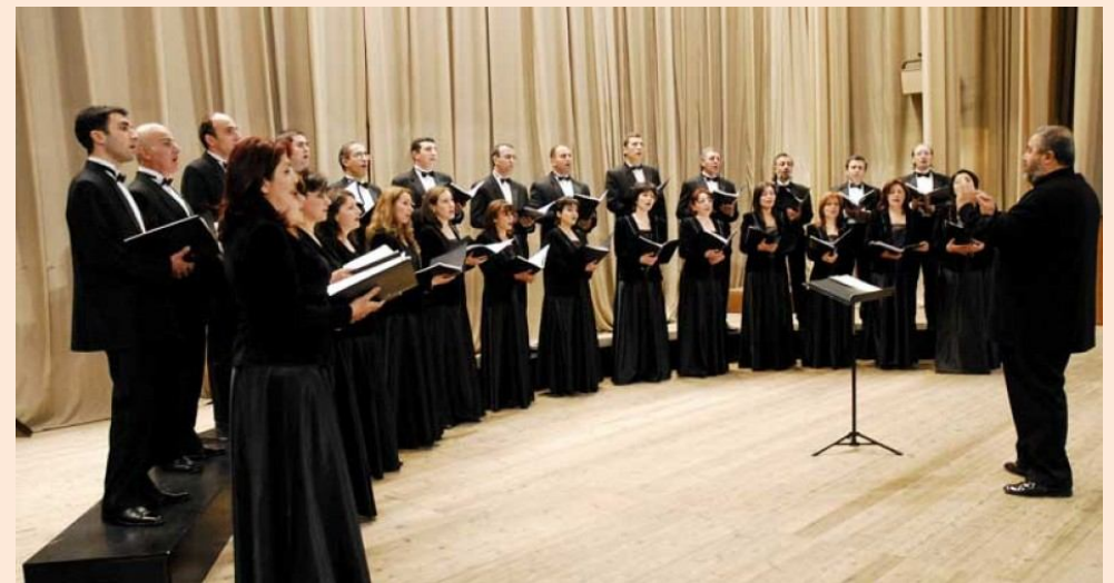
Nationaler Kammerchor Armeniens